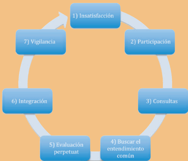
Figura 3 Modelo de cambio basado en las relaciones

El modelo basado en las relaciones abarca estrategias para construir y mantener relaciones, redes y procesos de comunicación, habilidades comunicacionales y para resolver problemas.